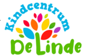
Het nieuwe logo

Bij de ontwikkeling tot kindcentrum hoort uiteraard ook een nieuw logo. Het nieuwe logo is gedurende het schooljaar ontwikkeld en uiteindelijk halverwege het schooljaar in gebruik genomen.